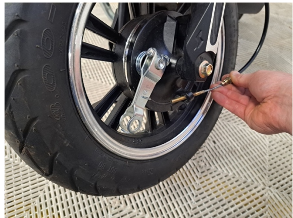
Vedä etujarru vaijeri pois pidikkeestä.