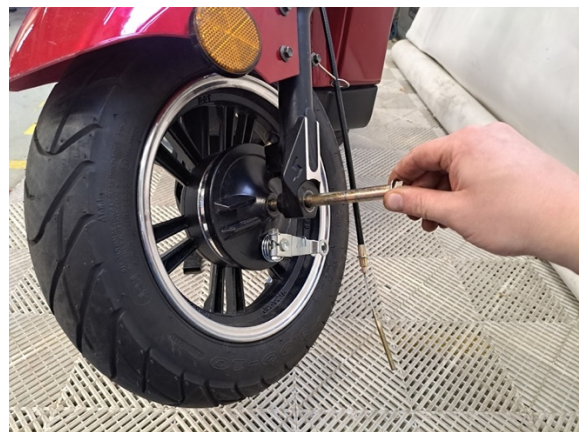
Ota etuakseli pois. Kannattele etupyörää samalla, ettei se pääse putoamaan hallitsemattomasti.