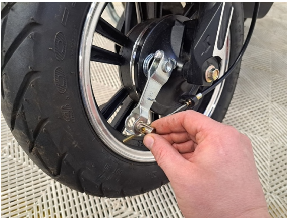
Ota etujarru vaijeri tappi pois.