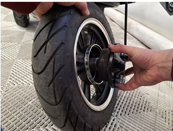
Ota etujarru kilpi pois.

Uuden osan asennus käänteisessä järjestyksessä.