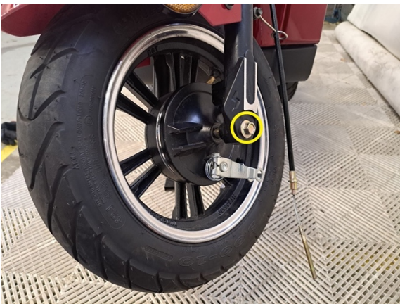
Avaa etuakselin pultti, (kiintoavain 13 mm) jolla on vastapuolella mutteri. (kiintoavain 17 mm).